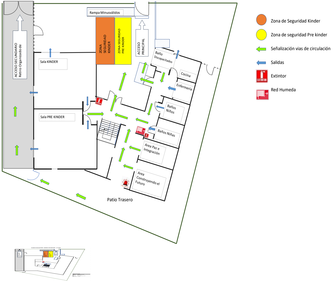
PLANO EVACUACIÓN JARDIN COYANCURA - 1º PISO